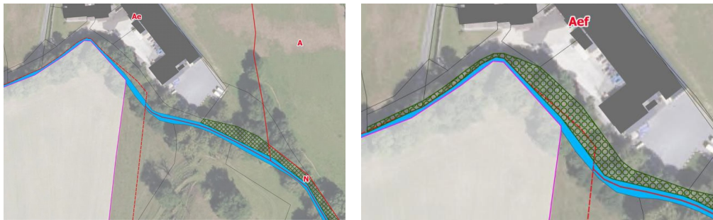
Figure 2 : Evolution du zonage du PLU avant / après modification , page 21

La seconde évolution du dossier porte sur l'extension aux boisements situés au sud de la fromagerie (parcelles cadastrées secteur D n°1271 et 1272) de la protection en espace boisé classé (EBC), selon l'article L.113-1 du code de l'urbanisme.